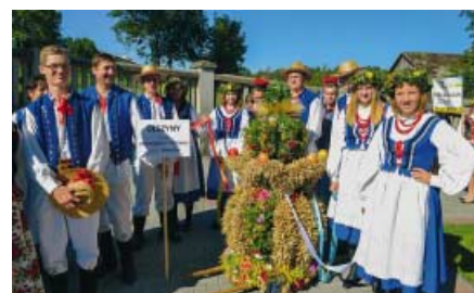
Nasza gminna reprezentacja wieńcowa tym razem z Olszyn