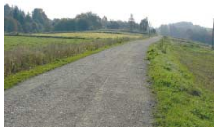
Droga w Turzy – Załęże stan po remoncie.

ków pozyskanych z budżetu Województwa Małopolskiego (związanych z wyłączeniem z produkcji gruntów rolnych) oraz Gminy Rzepiennik Strzyżewski.