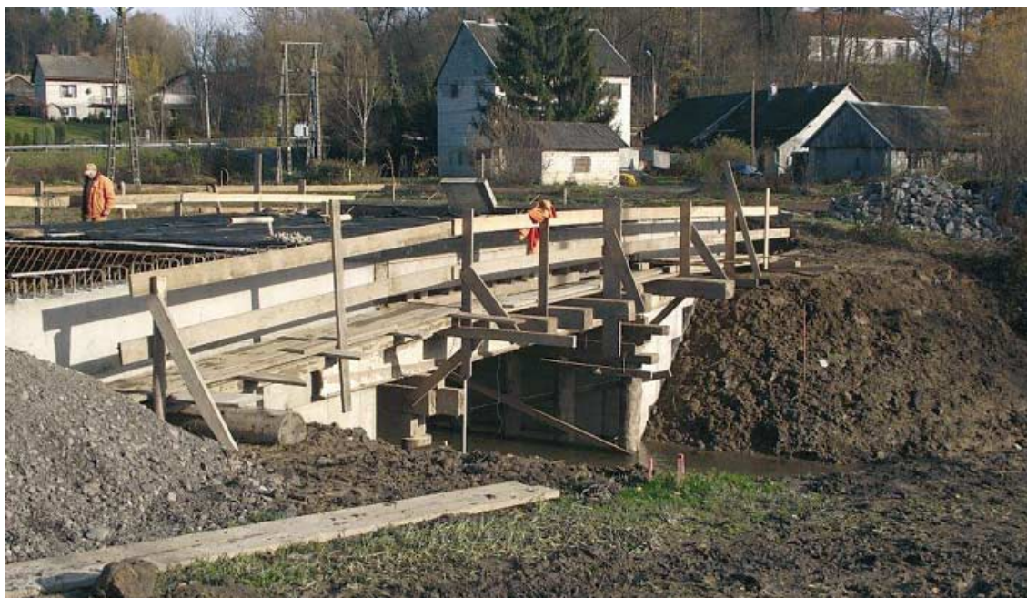
Zaawansowany stan prac przy budowie nowego mostu na Rzepiance w ciągu drogi gminnej w miejscowości Rzepiennik Biskupi. Do użytku oddajemy go przed końcem tego roku.