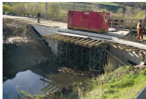
Stan prac przy moście na drodze powiatowej w kierunku Turzy. Prace zakończą się najpóźniej do końca roku, a po pozytywnym odbiorze przywrócone zostaną zasady ruchu obowiązujące przed remontem.

W Rzepienniku Biskupim wykonano nawierzchnię asfaltową na drodze w kier. p. Karasia. Roboty kosztowały 21.015,78 zł i zostały sfinansowane ze środków własnych Gminy Rzepiennik Strzyżewski, w tym z funduszu sołectkiego. Zakończyła się przebudowa dachu remizy Ochotniczej Straży Pożarnej w Kołkówce. Inwestycja w całości została zrealizowana ze środków własnych Gminy i kosztowała 49.727,77 zł.