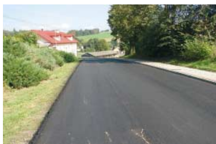
Nowa nakładka na drodze powiatowej w Olszynach

ny na nowe i bezpieczne dla zdrowia pokrycie dachowe. W Olszynach wykonano nową nakładkę asfaltową na drodze powiatowej. Nadto wykonano tam również nowy fragment chodnika i poszerzono jezdnię. Zakres robót obejmował: prace przygotowawcze, roboty ziemne, kanalizację deszczową, krawężniki, nawierzchnię