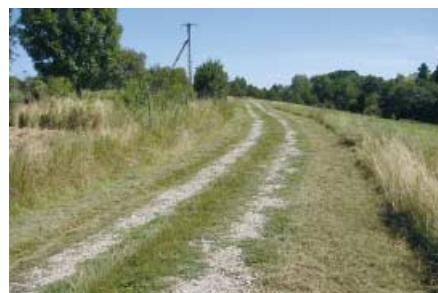
Droga w Turzy – Załęże stan przed remontem.