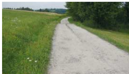
Droga w Rzepienniku Strzyżewskim w kierunku Jodłówki Tuchowskiej stan przed remontem.