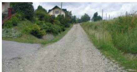
Droga w Rzepienniku Biskupim w kierunku p. Karasia stan przed remontem

nie chodników i zjazdów, skarpy, humusowanie, poszerzenie jezdni. Koszty robót wyniosły 100.015,36 zł i są podzielone po połowie pomiędzy Gminę Rzepiennik Strzyżewski i Powiat Tarnowski.