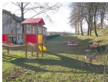
Tak się prezentuje nowy plac zabaw dla najmłodszych mieszkańców gminy zlokalizowany przy szkole w Rzepienniku Biskupim