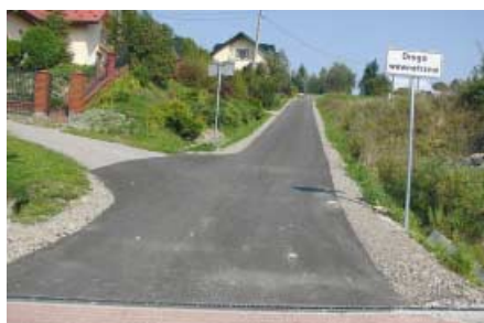
Droga w Rzepienniku Biskupim w kierunku p. Karasia aktualny stan po remoncie.

ny na nowe i bezpieczne dla zdrowia pokrycie dachowe. W Olszynach wykonano nową nakładkę asfaltową na drodze powiatowej. Nadto wykonano tam również nowy fragment chodnika i poszerzono jezdnię. Zakres robót obejmował: prace przygotowawcze, roboty ziemne, kanalizację deszczową, krawężniki, nawierzchnię