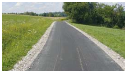
Droga w Rzepienniku Strzyżewskim w kierunku Jodłówki Tuchowskiej stan po remoncie.

Jeszcze w tym roku planuje się zakończyć odbudowę mostu w ciągu drogi gminnej „Rzepiennik Biskupi w kier. p. Kleszyków”. Wartość robót wynosi 399.600,94 zł. W większości koszty realizacji zostaną pokryte ze środków pozyskanej dotacji z rezerwy celowej budżetu państwa na usuwanie skutków klęsk żywiołowych. Położono też w ostatnich miesiącach nawierzchnię asfaltową na drodze w Rzepienniku Strzyżewskim w kierunku Jodłówki Tuchowskiej oraz wykonano nawierzchnię z kruszywa na drodze Turza – Załęże. Koszty robót wyniosły 95 718,60 zł i zostały pokryte ze środków