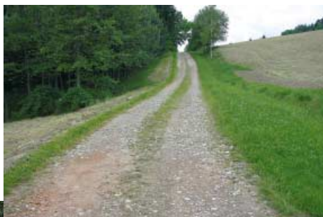
Droga w Turzy przed i po remoncie

Przeprowadzono przebudowę dróg dojazdowych do gruntów rolnych w Rzepienniku Biskupim, Turzy i Olszynach. Na realizację tych zadań pozyskano dotację ze środków budżetu Województwa Małopolskiego. Powstało 3 zmodernizowane odcinki, które wydatnie poprawią dojazd dla właścicieli gruntów.