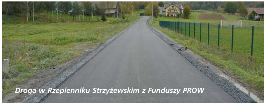
Droga w Rzepienniku Strzyżewskim z Funduszy PROW

Budujemy w tym roku następny fragment chodnika wraz z odwodnieniem przy drodze wojewódzkiej nr 980 tym razem w Rzepienniku Suchym. Roboty są dofinansowane przez Województwo Małopolskie w ramach pozyskanej przez Gminę dotacji.