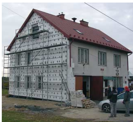
Remiza OSP w Kołkówce