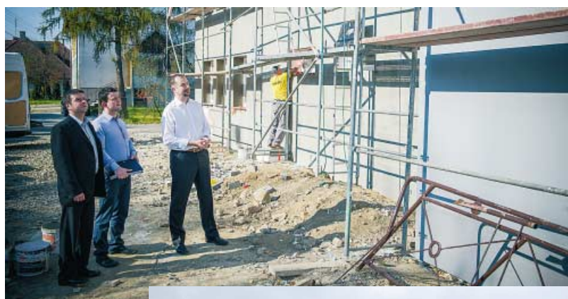
Remiza OSP w Rzepienniku Biskupim