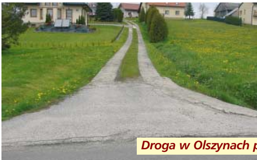
Droga w Olszynach przed i po przebudowie