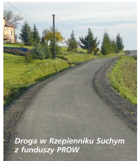
Droga w Rzepienniku Suchym z funduszy PROW

Zadania są współfinansowane ze środków Unii Europejskiej w ramach działania „Podstawowe usługi i odnowa wsi na obszarach wiejskich”, poddziałania „Wsparcie inwestycji związanych z tworzeniem, ulepszeniem lub rozbudową wszystkich rodzajów małej