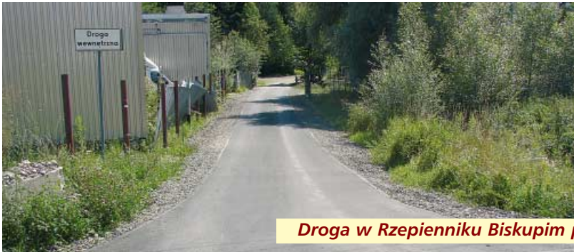
Droga w Rzepienniku Biskupim przed i po odnowieniu nawierzchni