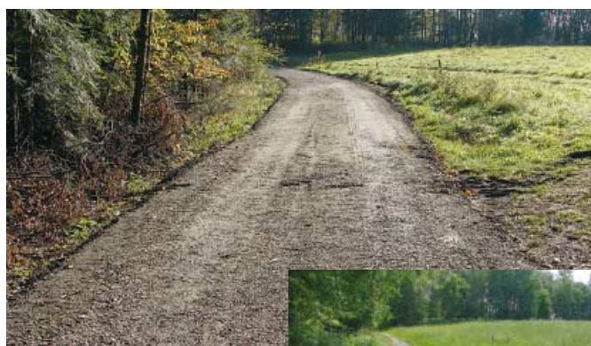
Droga w Olszynach przed i po przebudowie