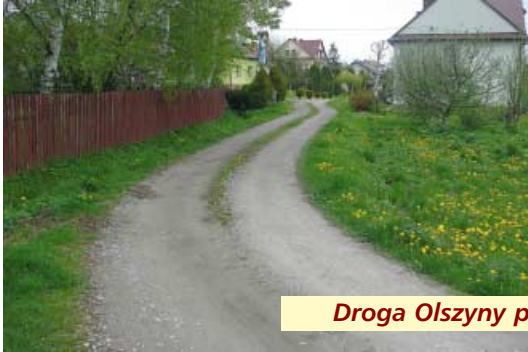
Droga Olszyny przed i po remoncie

Wyremontowano gruntownie trzy fragmenty dróg gminnych w Olszynach i Rzepienniku Biskupim. Dla porównania pokazujemy stan sprzed realizacji remontu i po remoncie.