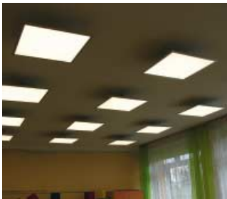
Wymiana oświetlenia w szkole w Turzy