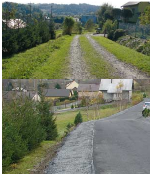
Droga Rzepiennik Strzyżewski - działki